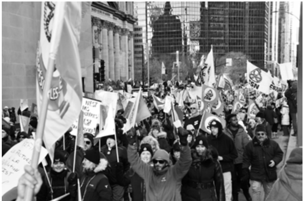
Grand rassemblement intersyndical du 29 novembre 2025, © André Query.

Nous comptons faire front avec tout le monde, ne plus jouer selon les règles, nous opposer avec nos collègues aux programmes des gouvernements présent et à venir et perturber tout appel à un retour à la normale.